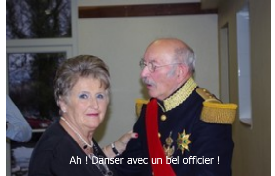
Ah ! Danser avec un bel officier !

Ils étaient près de 90 personnes à avoir répondu le 17 janvier dernier à l'invitation faite par la commune pour le traditionnel repas des aînés.