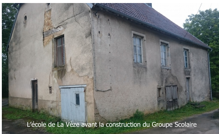
L'école de La Vèze avant la construction du Groupe Scolaire

Construit au début des années 50 pour remplacer l'ancienne école du village devenue trop vétuste et complètement inadaptée, le Groupe Scolaire de La Vèze nécessite au minimum que l'on fasse des travaux pour changer la toiture. L'occasion pour revoir ce bâtiment dans son ensemble et le mettre aux normes actuelles. C'est ainsi que des travaux d'isolation vont être entrepris, que la chaudière à fioul va être remplacée par un modèle à granulés de bois plus écologique, qu'un logement supplémentaire va être créé dans l'ancienne salle du conseil municipal et que les bureaux occupés actuellement par le syndicat du Marais vont être restaurés. Les travaux débuteront cet automne pour s'achever au printemps.