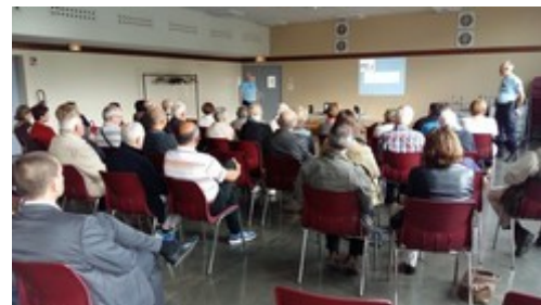
Le public était venu nombreux.