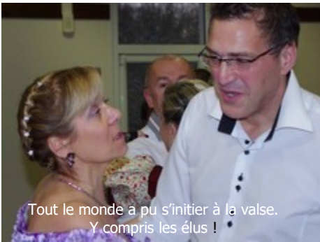
Tout le monde a pu s'initier à la valse. Y compris les élus !

Dans une ambiance joyeuse et conviviale, chacun a pu déguster l'excellent repas préparé par Le Vézois et servi par les élus. L'orchestre du cru, Les Véziers, assurait l'animation et faisait danser les convives entre chaque plat. L'après-midi s'est terminé avec le groupe « La Varsoivienne de Besançon » qui a dansé sur des airs de Johann Strauss en costume du Second Empire avant d'inviter ceux qui le souhaitaient à venir danser avec eux.