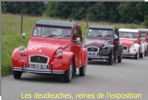
Les dedeuches, reines de l'exposition